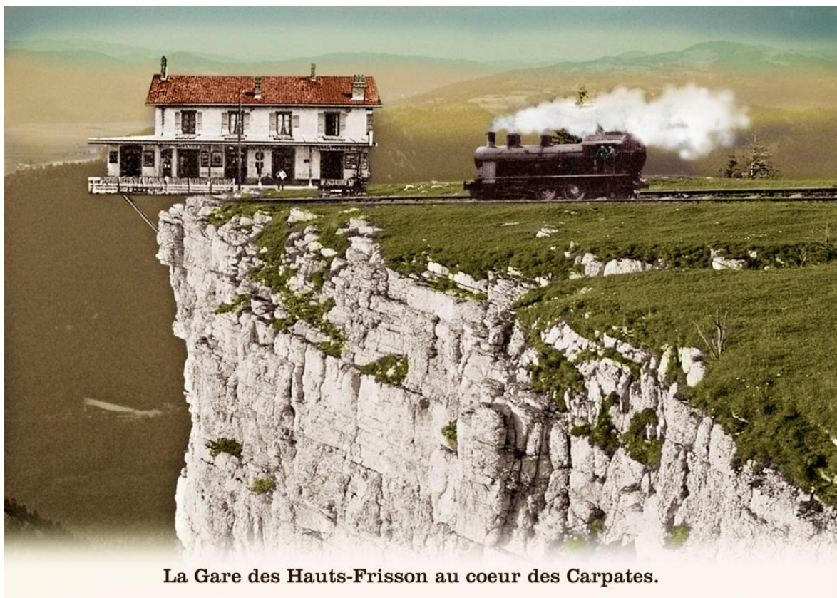
La Gare des Hauts-Frisson au coeur des Carpates.