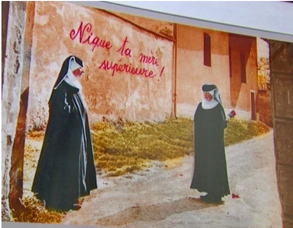
Plonk et replonk détournement d'anciennes cartes postales © Plonk et Replonk/

Voilà maintenant 14 ans que le collectif helvète s'empare de situations absurdes et détourne le sérieux pour imaginer des photomontages naïfs ou déjantés. Tout en conservant l'esprit d'antan des cartes postales, les trois complices s'amusent à décaler les métiers d'autrefois, les situations un peu désuètes et affublent les nouvelles images d'une légende à la fois très explicite et très allégorique. Ils sont publiés dans des journaux sérieux comme Le Temps ou dans le mensuel de BD Fluide Glacial. Leurs créations, diffusées dans les librairies suisses, françaises et belges sous formes de cartes, de livres mais aussi de calendriers, remportent un franc succès.