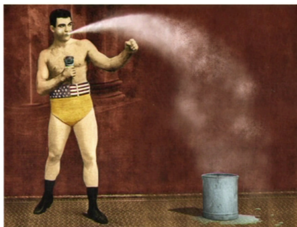
Métiers du spectacle: le cracheur d'eau.

Dès 1997, les détournements savoureux de cartes postales Belle Epoque font leur succès. Plonk & Replonk ont édité plus de 400 cartes postales humoristiques.